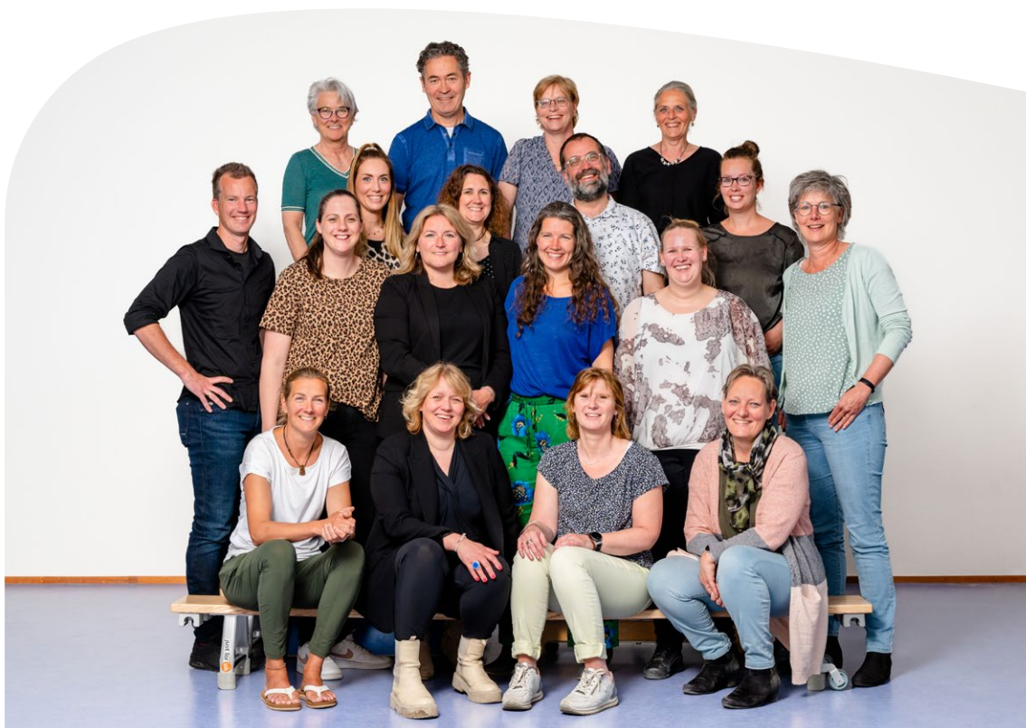
Team De Kopakker (NB: foto is een moment-opname. Niet alle huidige teamleden staan op de foto)