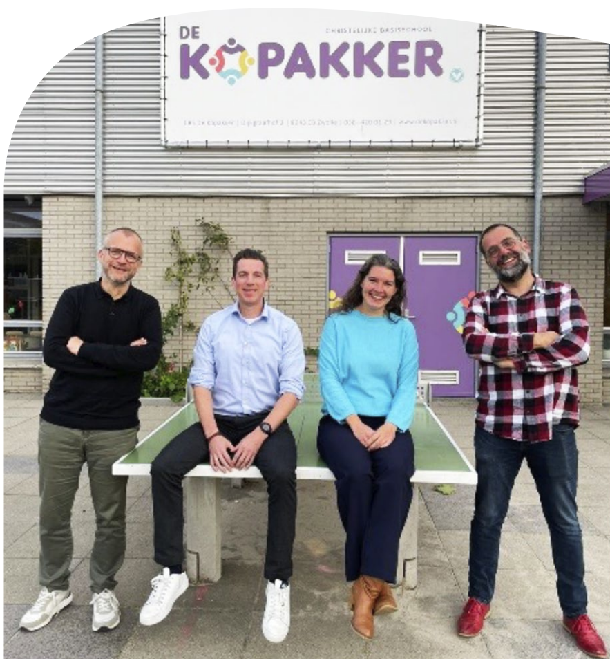
MR-geleding van CBS de Kopakker

De school kent ook een externe vertrouwenspersoon. U kunt de externe vertrouwenspersoon zien als een objectieve deskundige van buiten de school. Bij ingewikkelde situaties kan de interne vertrouwenspersoon de externe vertrouwenspersoon inschakelen. Dat kunt u als ouders ook